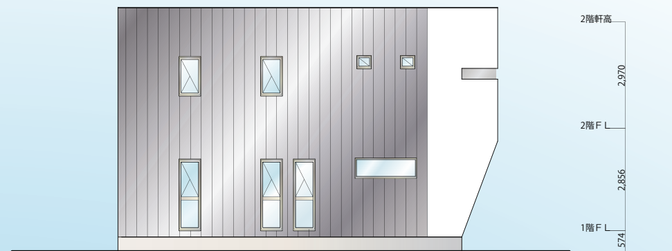
【 西立面図 S=1/100 】