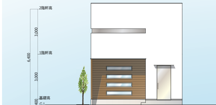
【 南立面図 S=1/100 】